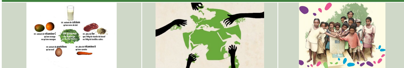
De gauche à droite : Les vertus nutritionnelles du Moringa, La surexploitation du milieu naturel par l'Homme, La construction d'infrastructure d'eau potable.