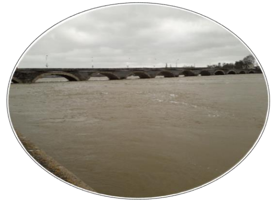
La Loire en crue

Préparation du projet : chacun va réaliser des dessins sur le thème de l'eau et lors la rencontre, ils visualiseront ces dessins. L'objectif est de dépasser la barrière de la langue et du handicap.