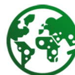
Agence Micro Projets